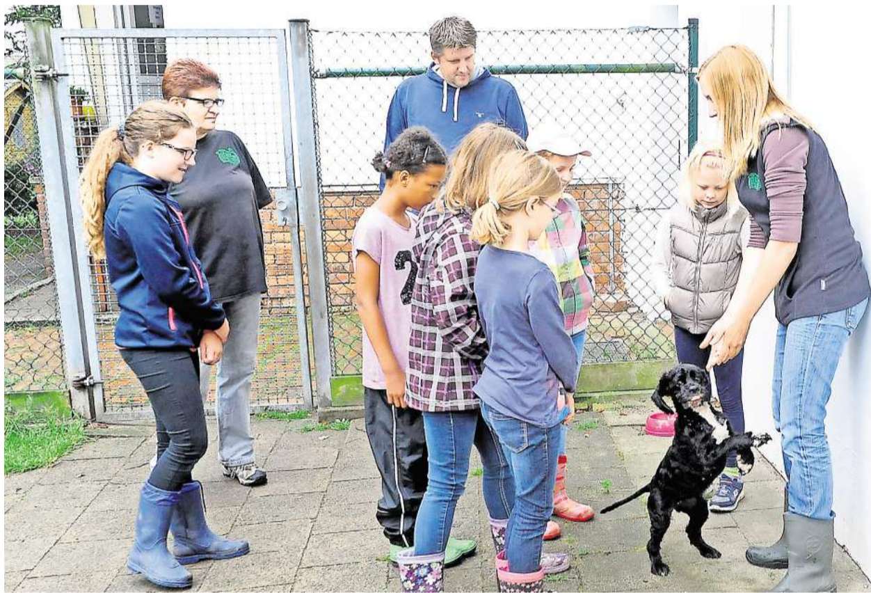
Ein Tag als Tierpfleger: Ferienspaßkinder aus der Samtgemeinde Isenbüttel packten im Ribbesbütteler Tierheim kräftig mit an.

Nach dem Rundgang packten die Kinder dann noch fleißig in Hunde- und Katzenhaus mit an. „Erstmal ist sauber machen angesagt“, sagten Busse und Schulze-Gaus. Danach gab es ein Frühstück für die kleinen Nachwuchs-Tierpfleger.